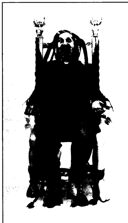
«Electricthrone» di Luigi Ontani, vincitrice del Premio Terna 2008, Categoria Terawatt